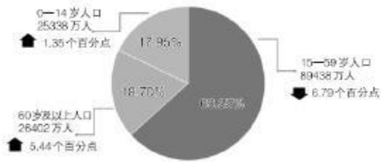
七普年龄构成图(与六普数据相比)